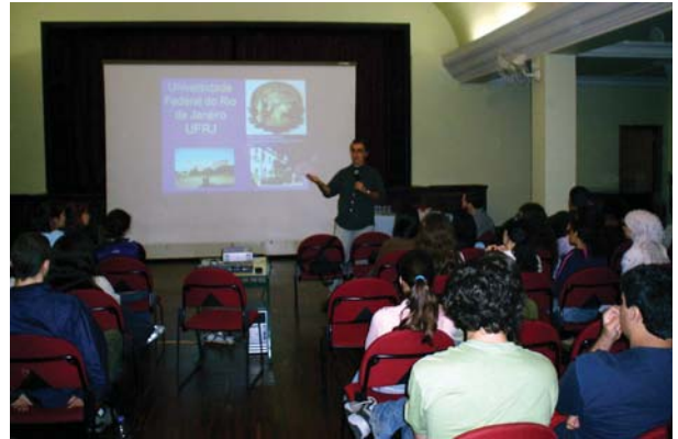
Alunos da turma 300 assistem à palestra sobre a UFRJ