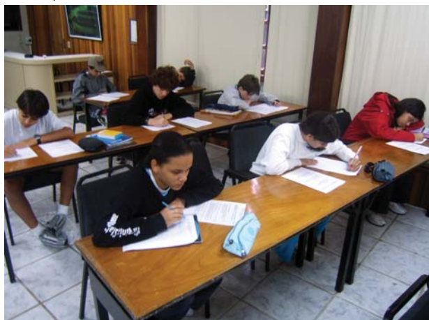
Durante a imersão, os alunos tiveram momentos de trabalho...