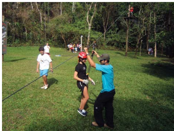
... e bons momentos de lazer

Es war ein von Erfolg gekrönter Versuch, der die Prüfungsergebnisse mit Sicherheit positiv beeinflusste, denn die ZDP wurde von allen Schülern bestanden!